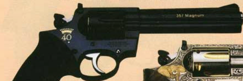
Revolver Korth modèle "Sport" de .357 Magnum, bronzé noir brillant, à poignée ronde, avec incrustations de marquages et filets en or.