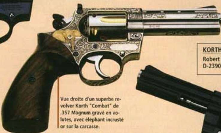
Vue droite d'un superbe revolver Korth "Combat" de .357 Magnum gravé en volutes, avec éléphant incrusté or sur la carcasse.

KORTH GERMANY GmbH Robert Bosch Strasse, 11 D-23909 RATZEBURG, Allemagne