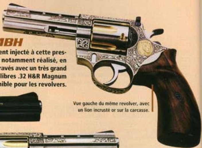
Vue gauche du même revolver, avec un lion incrusté or sur la carcasse.

Un sang nouveau a été récemment injecté à cette prestigieuse firme allemande, qui a notamment réalisé, en 2001, de merveilleux revolvers gravés avec un très grand talent. Par rapport à nos éditions antérieures, les calibres .32 H&R Magnum et 9 mm Parabellum ont disparu de la gamme disponible pour les revolvers.